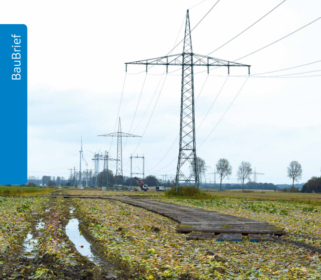
„Schietwetter“ auf der Baustelle