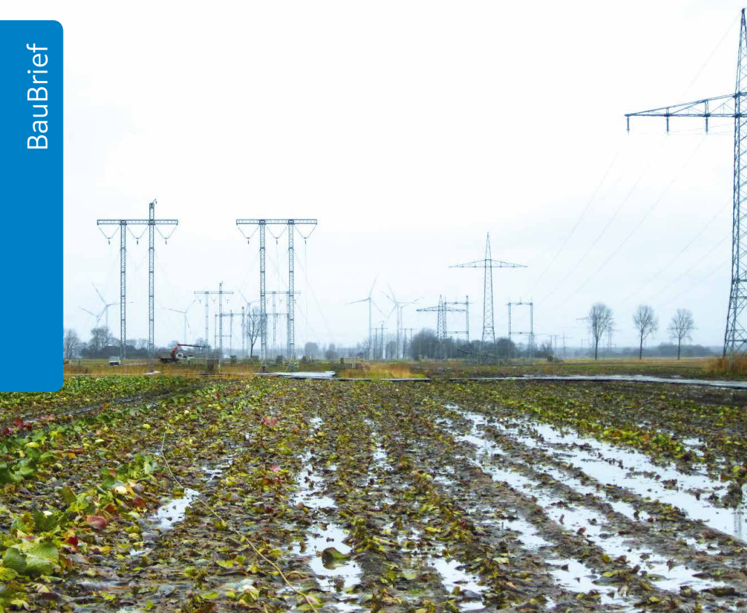
Mastprovisorien auf dem dritten Bauabschnitt